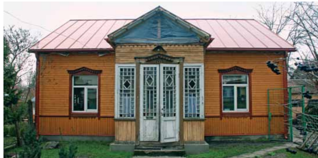
Sodybinis namas. J. Kraševskio g. 7, Žaliakalnis