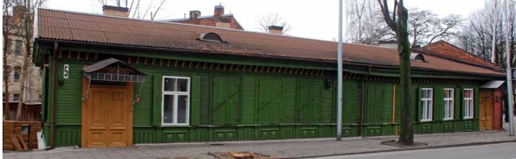
Miestiečio namas. K. Donelaičio g. 5, Naujamiestis