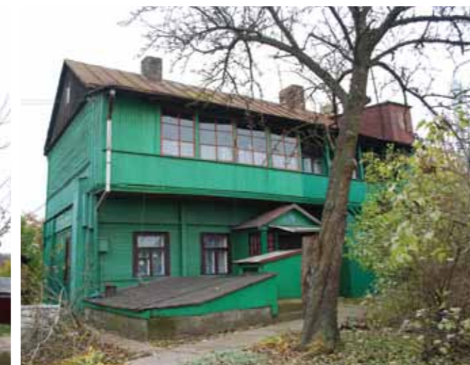
Nuomojamas namas. Jurbarko g. 73, Viljampolė