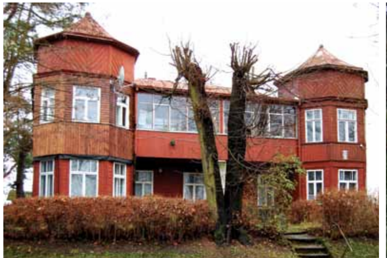
Vasarnamis. A. Smetonos al. 29, Panemunė