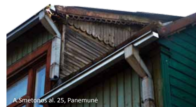
A.Smetonos al. 25, Panemunė

gyvenimo laiką, tokiu būdu paliktume šansą dar kelioms kartoms pažinti tikrąjį medinio namo vaizdą. Atliekant tyrimą, tapo aišku, jog medinio namo išsaugojimas priklauso tiek nuo miesto valdžios požiūrio, tiek nuo specialistų kompetencijos, tiek ir nuo savininkų geranoriškumo. Deja, suinteresuotų pusių poreikiai dažnai radikalai skiriasi: paveldosaugos institucijos iškelia reikalavimus, o savininkui rūpi kuo pigesnėmis priemonėmis pagerinti būsto komfortą.