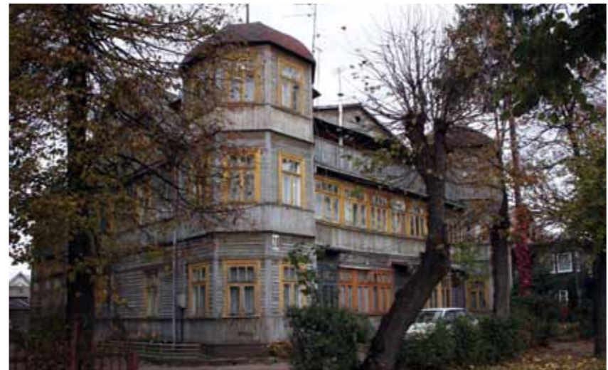
Vasarnamis. Gailutės g. 28, Panemunė

Šančiuose išsiskiria mediniai kariškių ir geležinkieliečių namai (kariškių namų buvo ir Fredoje). Kariniame Šančių miestelyje (pastatytas 1895–1899 m.) mediniai vieno aukšto namai buvo skirti puskarininkiams. Neaukšti dvišlaičiai stogai dengti skarda, pastogės juosia vienodos drožinėtos juostos, primenančios rusišką medinę architektūrą (A. Juozapavičiaus pr. 15, 40 ir kt.). Standartiški dekoru variantai įprasti šio tipo pastatams. Modifikuotą rusiško stiliaus dekorą turi ir geležinkelio tarnautojų namai, iškilę XIX a. pabaigoje netoli stoties. Jų tūriai ir dekoras tarpusavyje skiriasi nežymiai. Rusiški drožiniai ir langų apvadai derinami su tuo metu Europoje populiaraus šveicariško stiliaus elementais – išsikišusių stogų gegnių profiliavimu bei sunertomis gegnių stygomis trikampėse pastogėse (Tunelio g. 17, A. Juozapavičiaus pr. 124c, 125, 131). Žymiai kuklesni sodybiniai Šančių darbininkų namukai. Jie buvo statomi Nemuno pakrantėje, mažose gatvelėse.