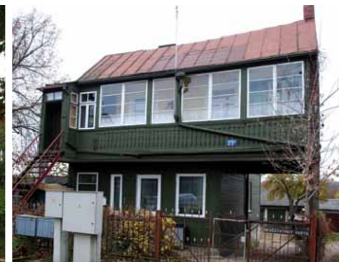
Nuomojamas namas. Jurbarko g. 25a, Viljampolė