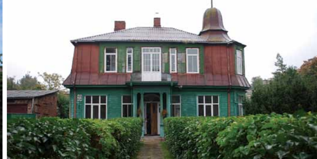
Vila. K.Petrausko g. 23, Žaliakalnis