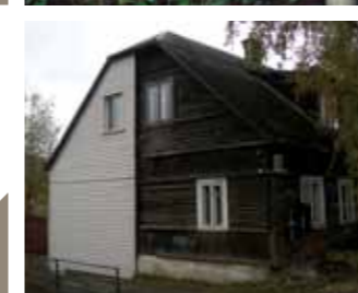
Netinkamai saugomos medinės architektūros pavyzdžiai. Žaliakalnis, Šančiai, Naujamiestis