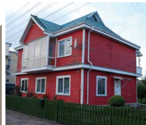
Netinkamai saugomos medinės architektūros pavyzdys. Šančiai