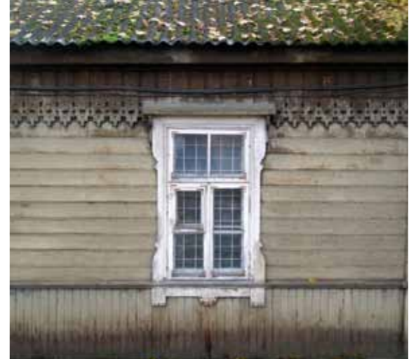
Geležinkieliečių namas. A. Juozapavičiaus pr. 131, Šančiai