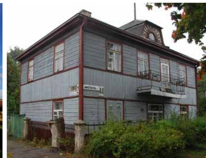
Nuomojamas namas. Žemuočių g. 2 / Aukštaičių g. 44, Žaliakalnis