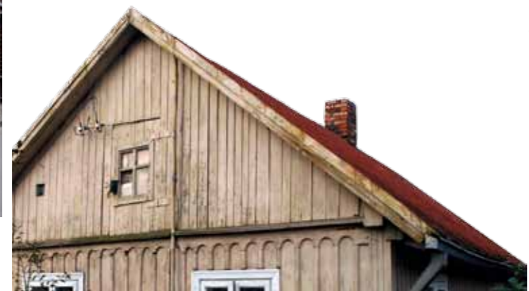
Miestiečio namas. K. Donelaičio g. 7, Naujamiestis

Projekte dalyvavo VDU Menų fakulteto kultūros paveldo ir turizmo, meno istorijos ir kritikos bei VDA KDF architektūros specialybių magistrantai. Buvo apžiūrėti Naujamiestio, Žaliakalnio, Panemunės, Šančių ir Vilijampolės rajonai, vis dar stebinančios medinio paveldo gausa ir įvairovė. Atrinkti įdomios, išsiskiriančios architektūros objektai ir pažvelgta į juos iš arčiau: atlikta detali fotofiksacija, patyrinėta namų istorija, kalbinti namų savininkai, stengtasi išaiškinti, kokie sunkumai ir poreikiai iškyla gyvenant ir tvarkantis sename mediniame name. Nemaža dalis savininkų didžiavosi turimu namu, suvokdami jo unikalumą, istorinę vertę. Daugelyje namų galėjome pamatyti autentiškus baldus, krosnis, langus, duris, lubas, parketo arba lentų grindis. Tačiau beveik visi šeimininkai stokoja lėšų rimtesniems remonto darbams, o įpareigojimas namą restauruoti gąsdina kaip finansiniu požiūriu nepakeliama užduotis. Nors ir gerbdami namo senumą bei atpažindami jo meninę vertę, dauguma savininkų vis dėlto pirmenybę teikia ne autentiškumo išsaugojimui, bet namo atnaujinimui, komfortiško būsto įrengimui.