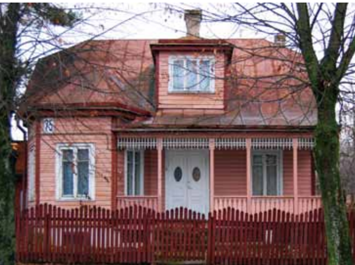
Vila. A. Smetonos al. 75, Panemunė

Sovietmečiu daugelis medinių namų buvo nacionalizuoti, naujai atsikėlusieji gyventojai neturėjo intereso ir lėšų juos remontuoti. Dalis namų, ypač didesnių, šiuo