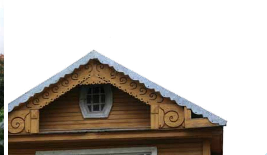
Vila. Gaillutės g. 19, Panemunė