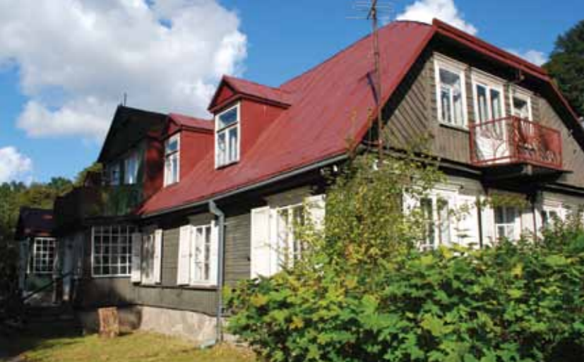
Dvarelis. K. Būgos g. 4, Naujamiestis