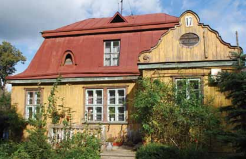
Vila. Vydūno al. 17 / Minties rato g. 2, Žaliakalnis