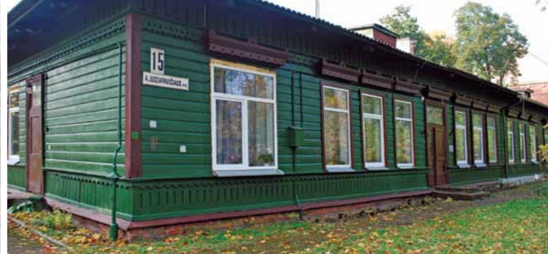
Kariškių namas. A. Juozapavičiaus pr. 15, Šančiai