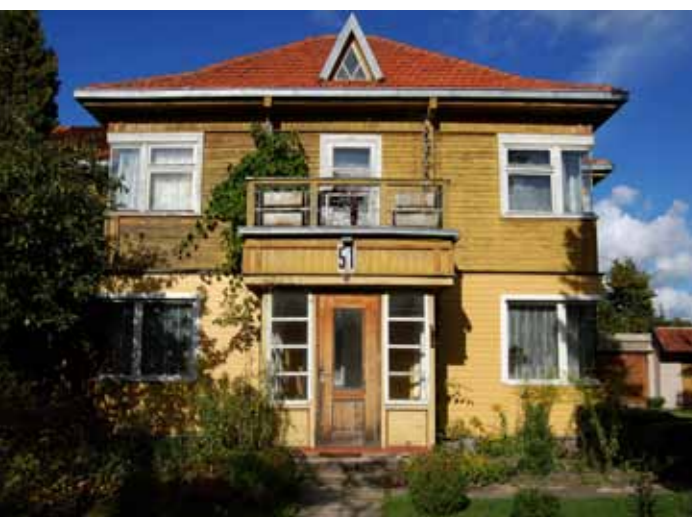
Kotedžas. Minties rato g. 51, Žaliakalnis